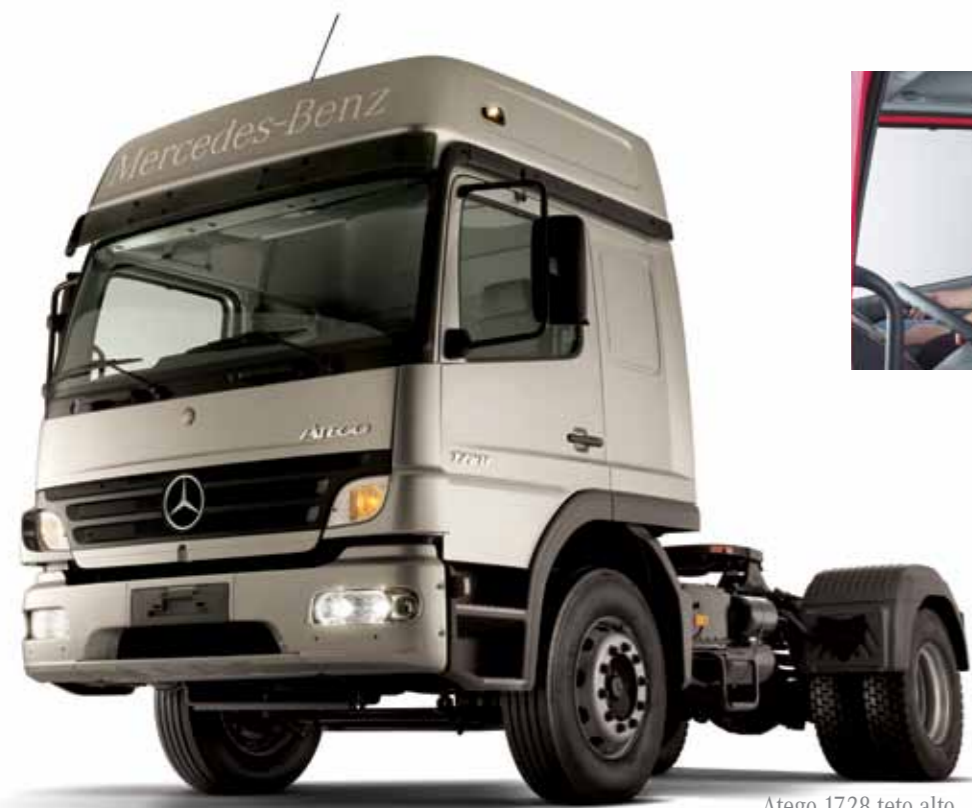
Atego 1728 teto alto