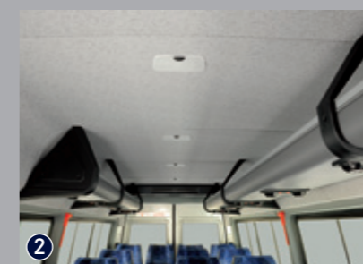
19+1 Assentos reclináveis